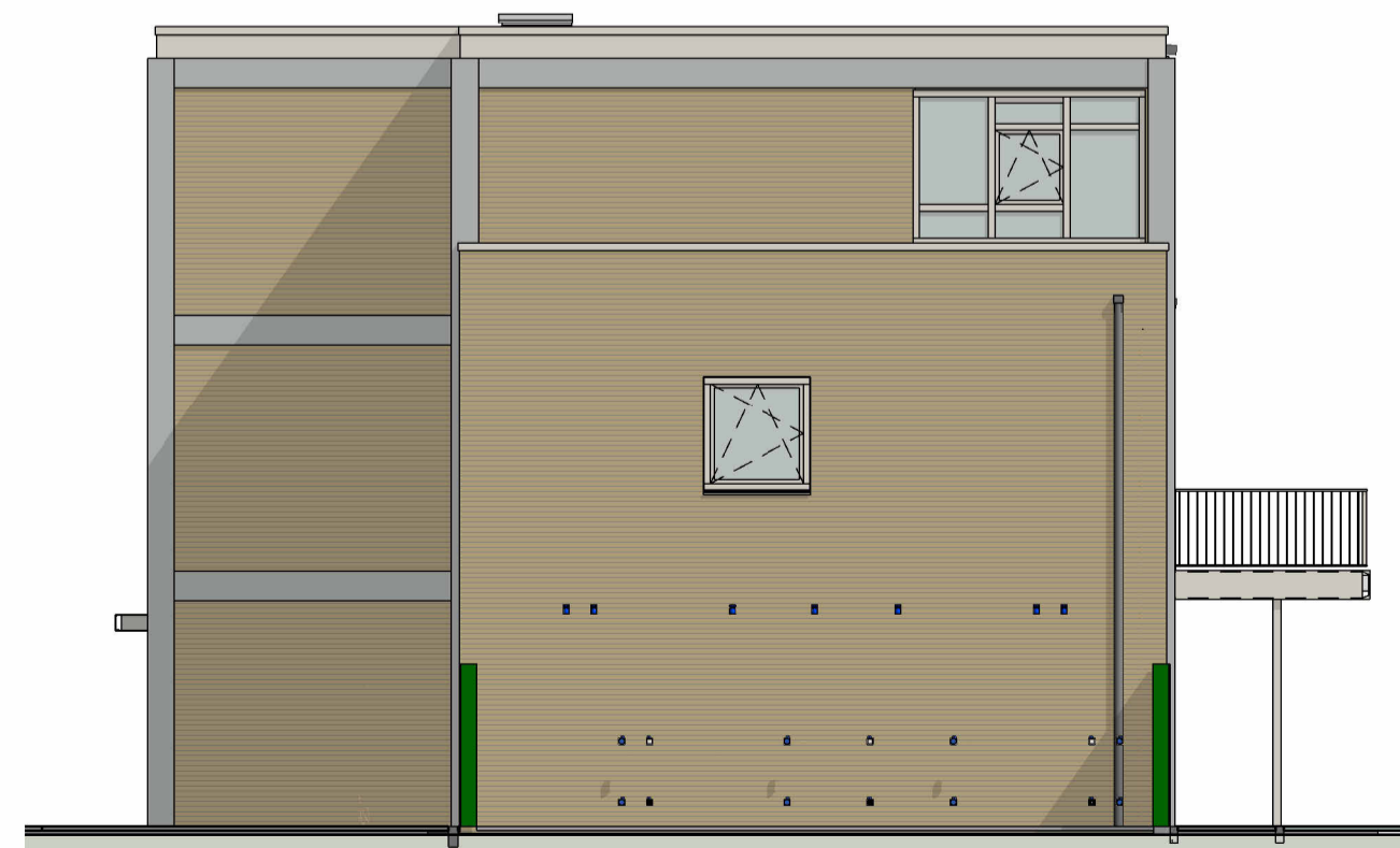
rechtgergevel (gebouw C)

De genoemde maten zijn circa maten, aangeduid in millimeters.