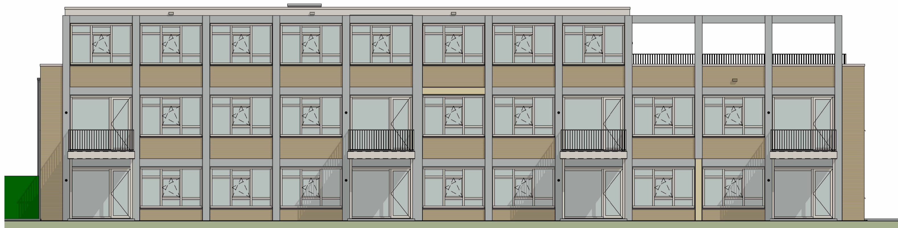
achtergevel (gebouw C)